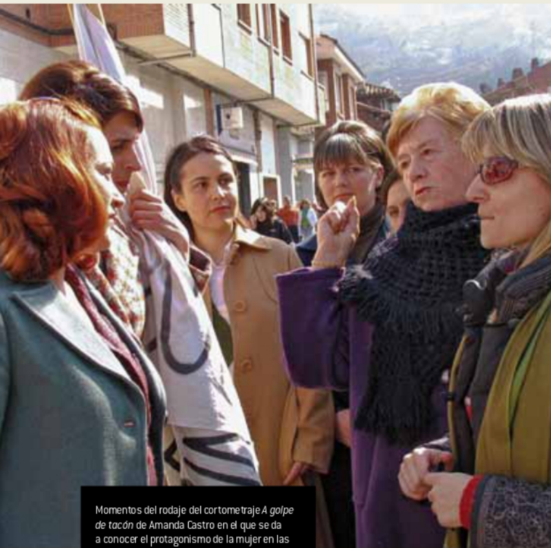
Momentos del rodaje del cortometraje A golpe de ración de Amanda Castro en el que se da a conocer el protagonismo de la mujer en las huelgas y movilizaciones que mantuvieron los mineros asturianos contra la dictadura franquista a principios de los años sesenta.

DE LA TRANSICIÓN (1973-1982) editado por KRK con la colaboración del Instituto de la Mujer del Gobierno del Principado de Asturias.